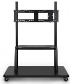
VB-STND-001 Rollwagen EAN 76690794761 8