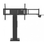
VB-STND-004 Elektrisch höhenverstellbarer Bodenstandfuß EAN 76690798341 8