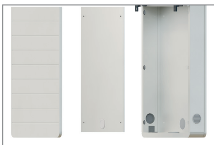
Einfache Montage durch herausnehmbare AV-Montageplatte