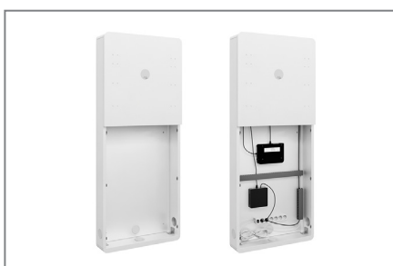
AV-Zubehör findet im Inneren problemlos Platz