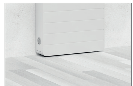
Stellfüße unter dem Möbelkorpus sorgen bei Bedarf für einen Niveaueausgleich